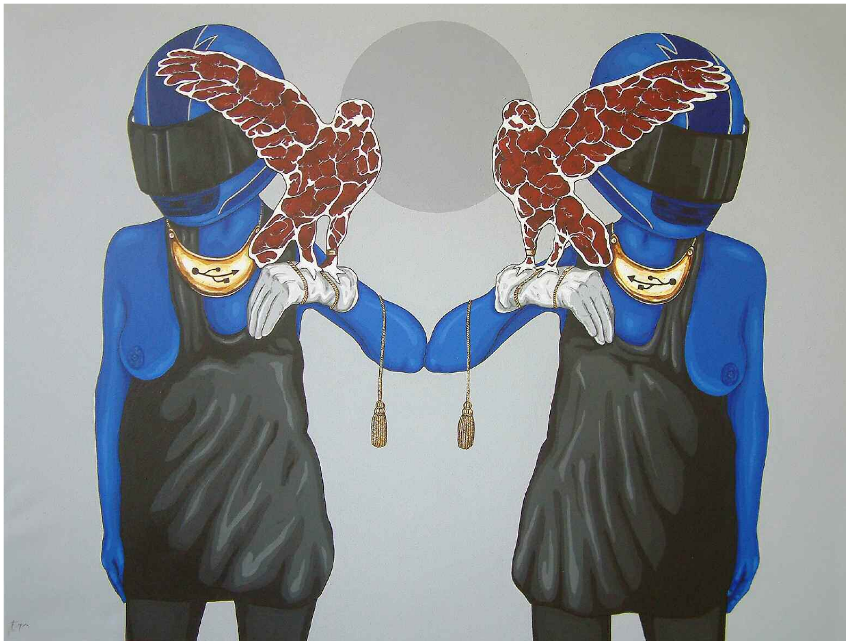
Espira - WROCLAW Acrylique sur toile - 91x122 cm. Pièce unique, 2009.