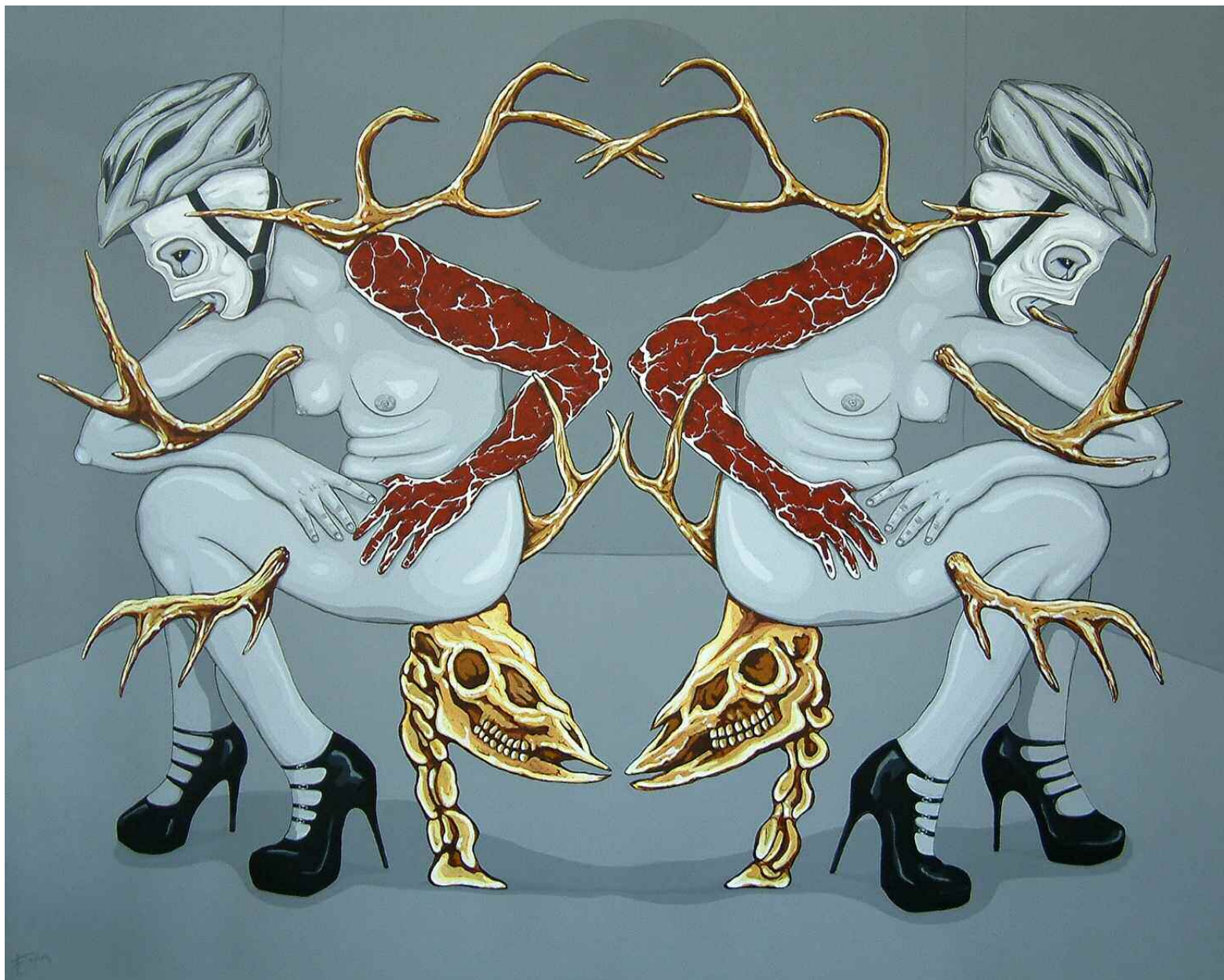
Espira - ALL THINGS MOVE TOWARD THEIR END Acrylique sur toile - 122x153 cm. Pièce unique, 2009.