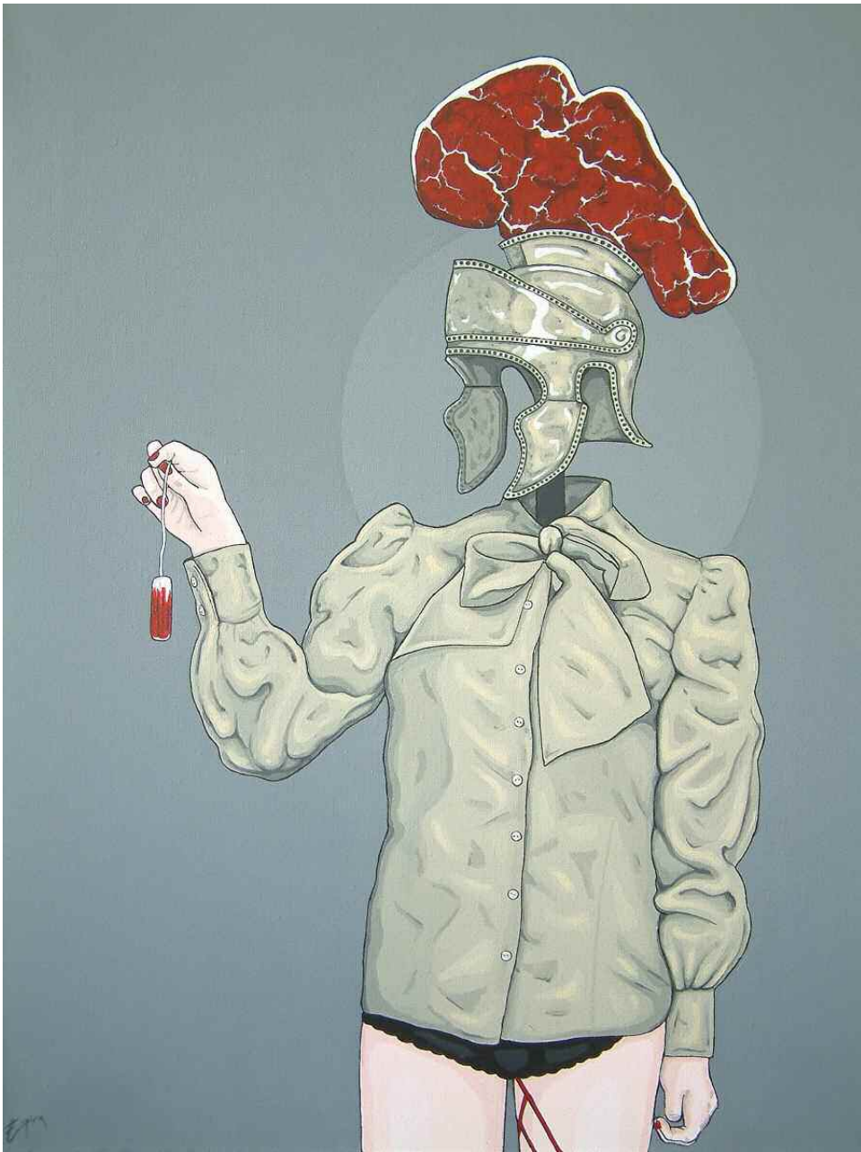
Espira - SUFFRAGETTE Acrylique sur toile - 76x61 cm. Pièce unique, 2009.