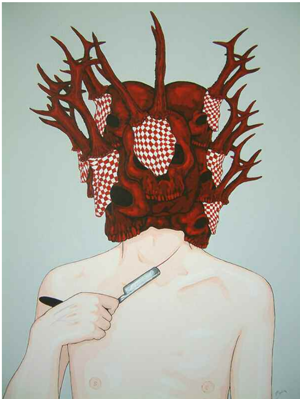
Espira - 1939 Acrylique sur toile - 76x61 cm. Pièce unique, 2009.