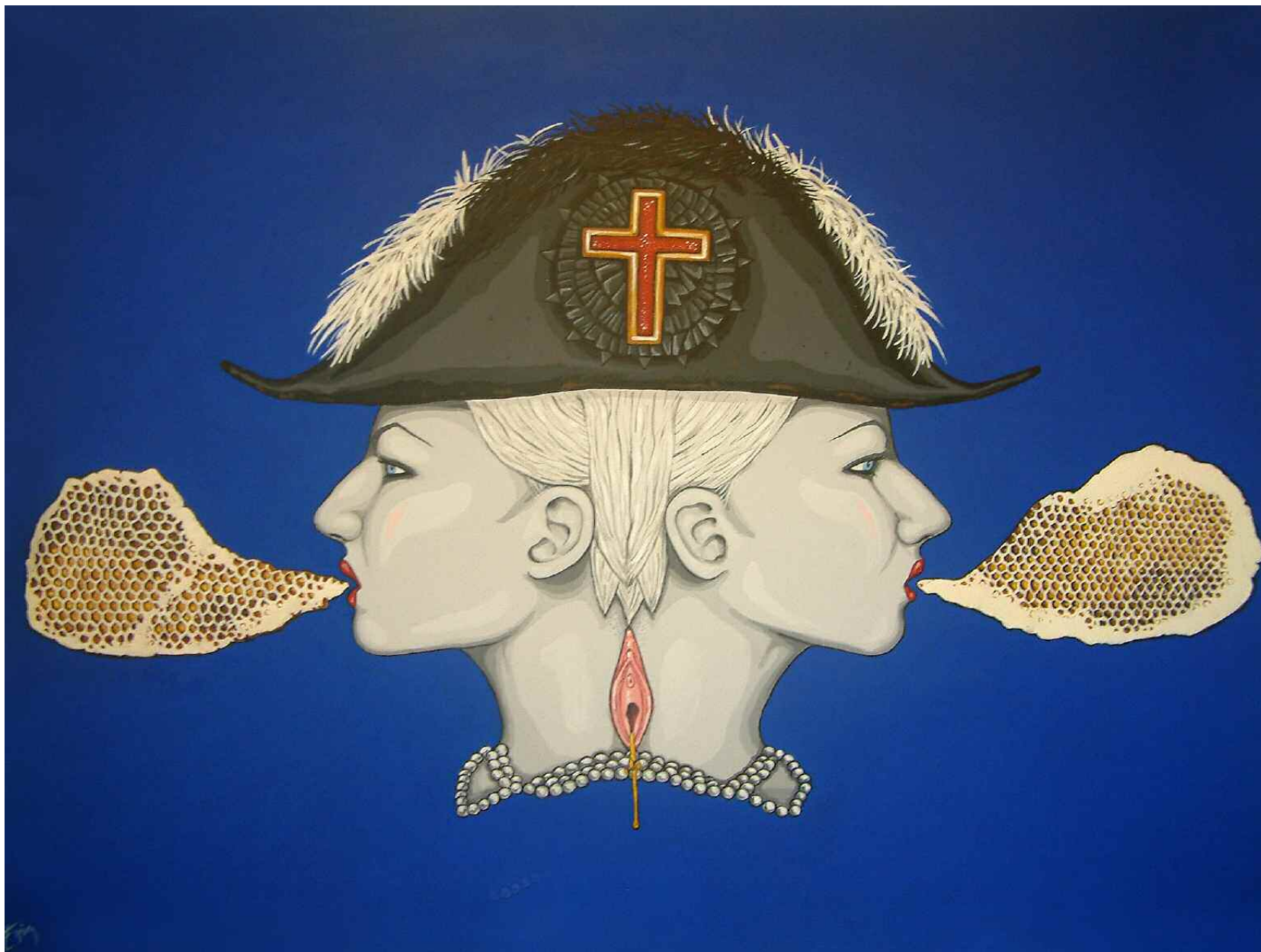
Espira - MANKO REGINA Acrylique sur toile - 71x101 cm. Pièce unique, 2010.