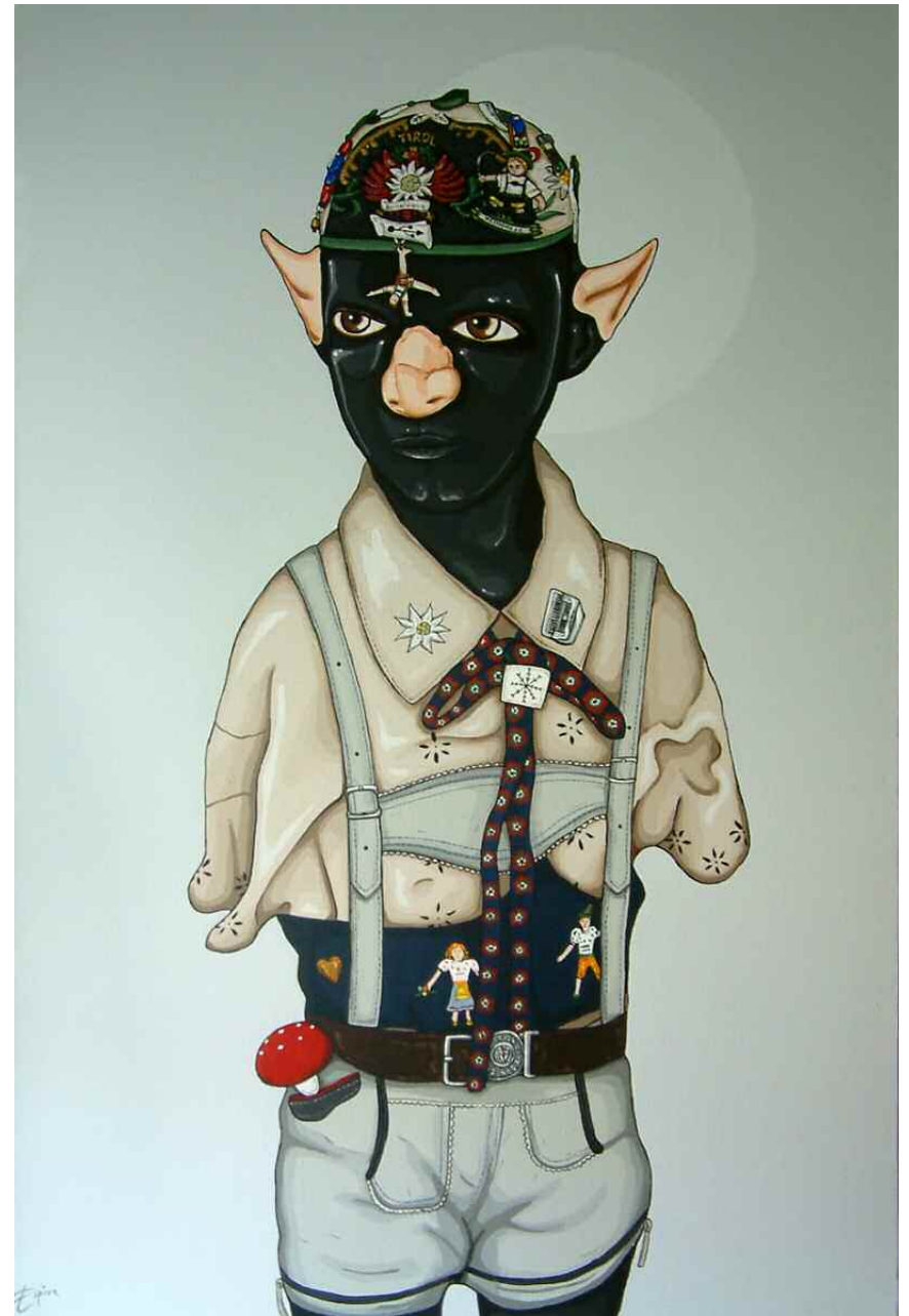
Espira - DAVID'S CHILD Acrylique sur toile - 91x60,5 cm. Pièce unique, 2009.