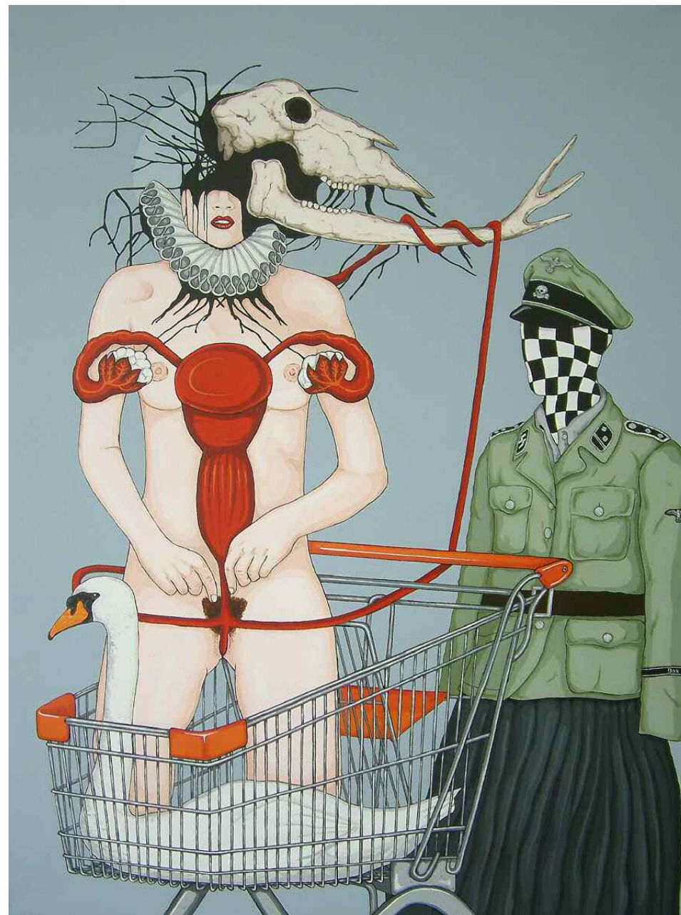
Espira - KRAKOW Acrylique sur toile - 122x91 cm. Pièce unique, 2009.