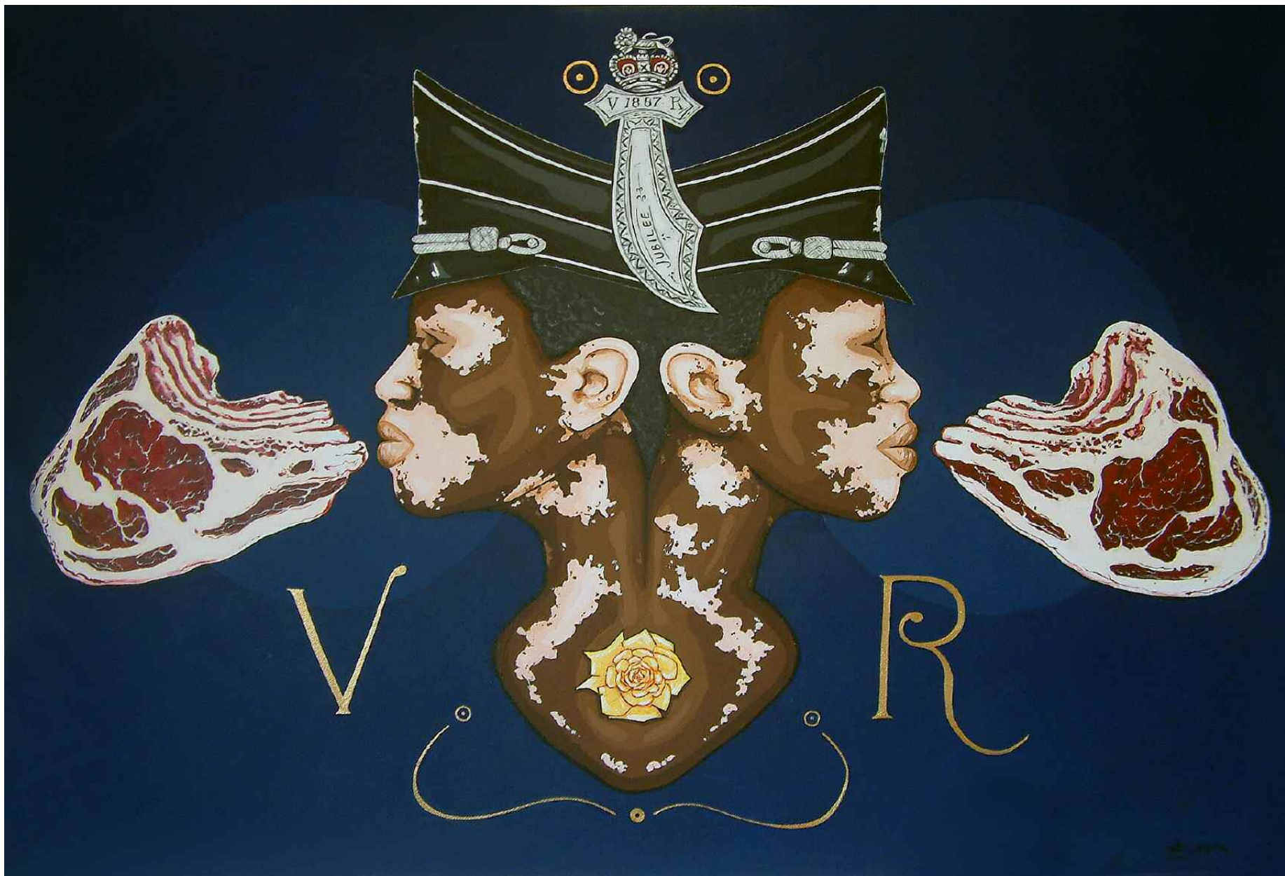
Espira - VITILIGO REGINA Acrylique sur toile - 61x91 cm. Pièce unique, 2010.